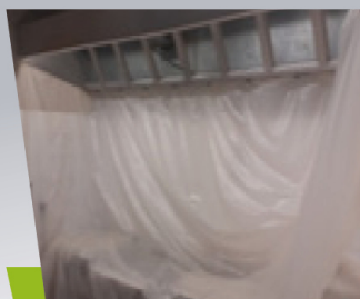
Mise en place des protections