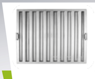
Dégraissage des filtres